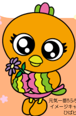
元気一番!!ふちゅう体操 イメージキャラクター ひびー

内容についての不明点などございましたら、 いつでもいきいきプラザへご相談ください♪